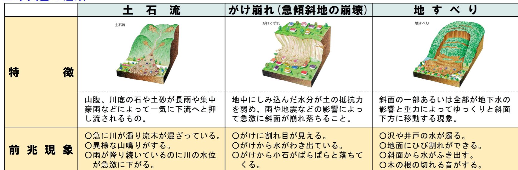
イラスト 資料提供：NPO法人土砂災害防止広報センター