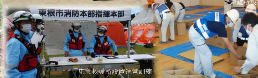
応急救護所設置運営訓練