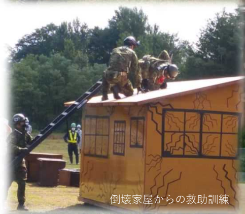
倒壊家屋からの救助訓練