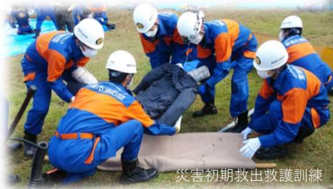
災害初期救出救護訓練