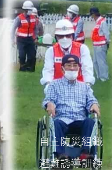
自主防災組織 避難誘導訓練