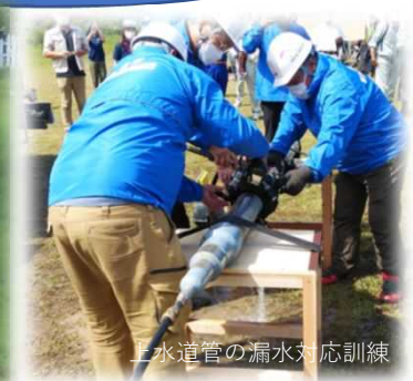
上水道管の漏水対応訓練