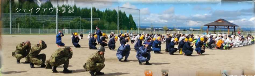
シェイクアウト訓練