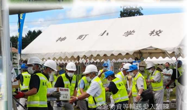
緊急物資等輸送受入訓練