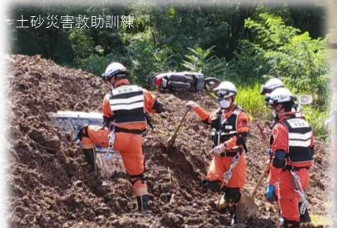
土砂災害救助訓練