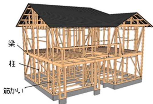
在来木造住宅 (軸組工法)