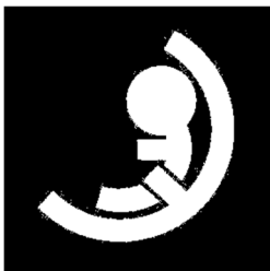
チャイルドシート表示マーク

平成 19 年度、すべての座席のシートベルトとチャイルドシートの正しい着用の徹底を図るため、「チャイルドシート表示マーク」を公募により作成した。