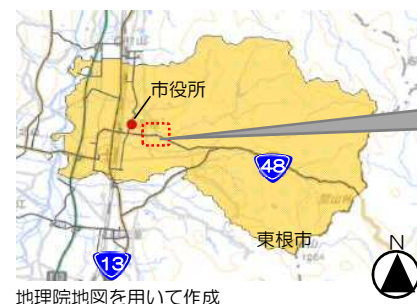
地理院地図を用いて作成