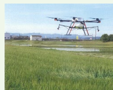
【例】スマート農業機器の活用