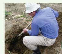
土壌診断に基づく土づくり