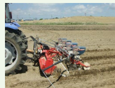
大豆300A技術 (不耕起播種栽培など)